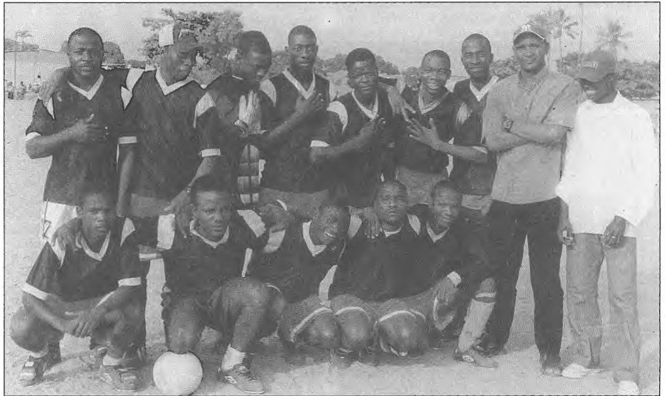
Benguela — A nossa equipa de futebol.

FUTEBOL — Apesar de parecer, por algum tempo, desestabilizado, volta ao seu costume de organização. Toda a malta foi convocada a partici-