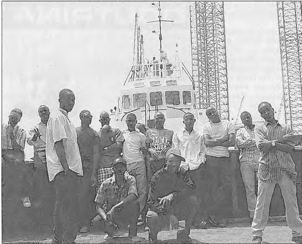
Visita de estudo de um grupo dos nossos rapazes ao Porto do Lobito