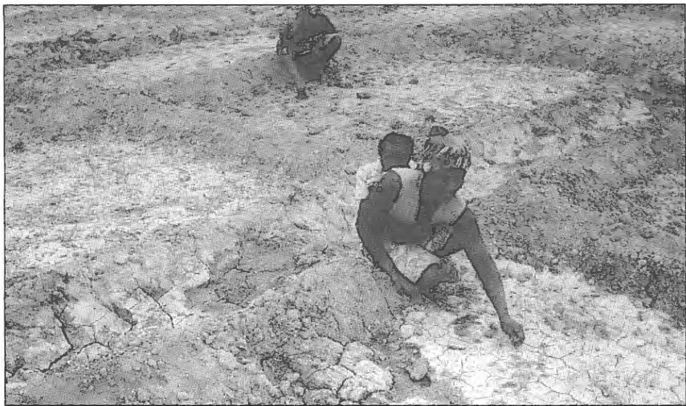
Monda de cebola